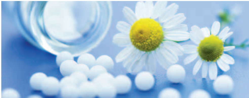
Die Komplementärmedizin liegt im Trend.