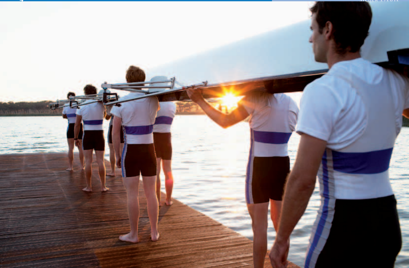
Personen, die gemeinsam Sport ausüben, verfolgen ein gemeinsames Ziel.