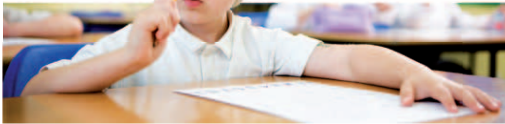
Blackout – plötzlich ist der Kopf leer.

Bis heute sind die Gründe, die zu einem Blackout führen, nicht vollständig geklärt. Man glaubt, dass evolutionsbedingte Mechanismen eine zentrale Rolle spielen. Hat der Mensch Angst oder Stress, laufen die gleichen körperlichen Reaktionen ab wie vor Hunderttausenden von Jahren. Früher musste der Mensch beispielsweise vor einem Tier flüchten. Dies löste in ihm Stress aus. Eine schwierige mündliche Prüfung kann zu den gleichen Reaktionen im Körper führen wie früher ein gefährliches Tier: Puls und Blutdruck steigen, die Muskeln verspannen sich. Der Körper schüttet vermehrt Stresshormone aus. Dies