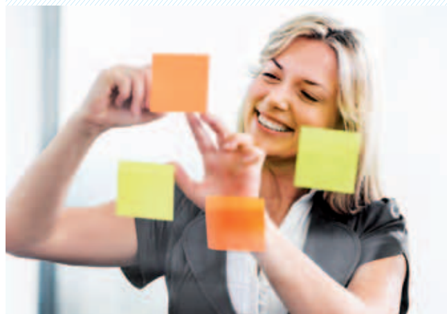
Mehrere Krankenversicherer ermöglichen die freie Wahl.

Das RVK-Forum nimmt die Diskussion über EbM auf. Referenten aus dem Gesundheitswesen setzen sich am 25. April 2013 mit dem Für und Wider von EbM auseinander. Dabei kommen alle wesentlichen Blickwinkel zur Sprache: jene der Krankenversicherer, der Leistungserbringer, des Bundesamts für Gesundheit, aber auch von Ökonomen und Patientenvertretern. Stephan Klapproth von SRF moderiert die Tagung. Für spannende Diskussionen ist somit gesorgt.